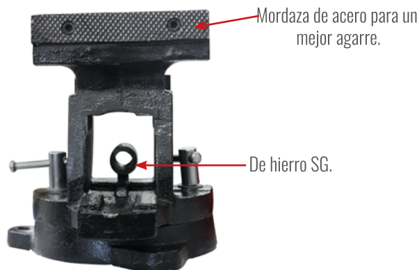
Mordaza de acero para un mejor agarre.